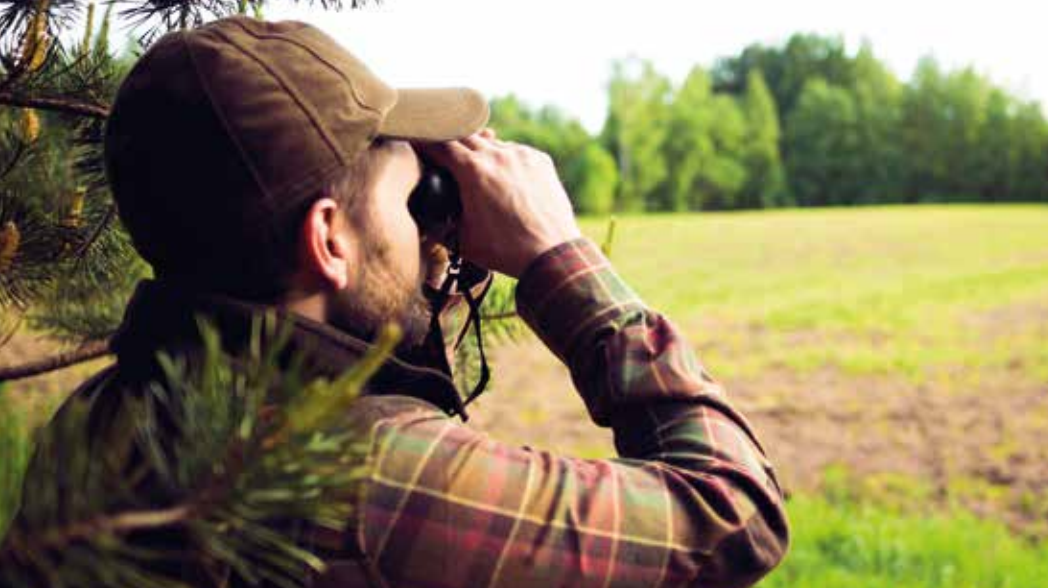
Wie wird die Zukunft der Jagd aussehen?