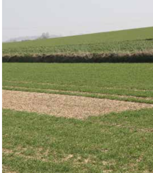
Lerchenfenster im Getreide