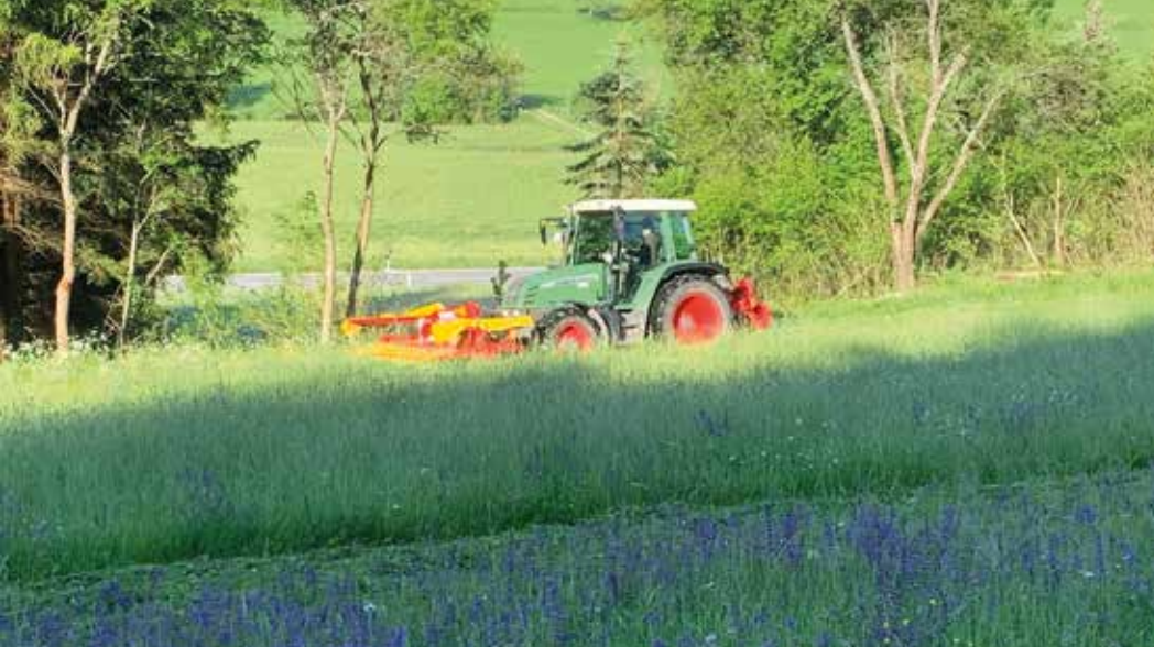
Mahd heute mehrmals im Jahr in kürzester Zeit und großer Fläche gleichzeitig.