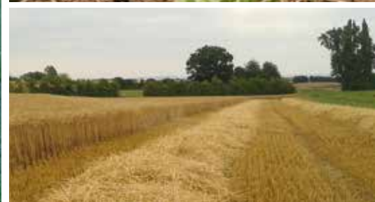
Anstieg von Betriebsgrößen/-flächen