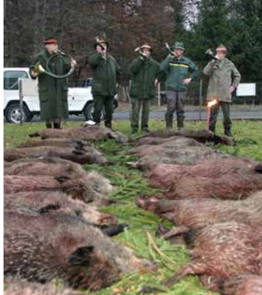
Strecke mit Sauen