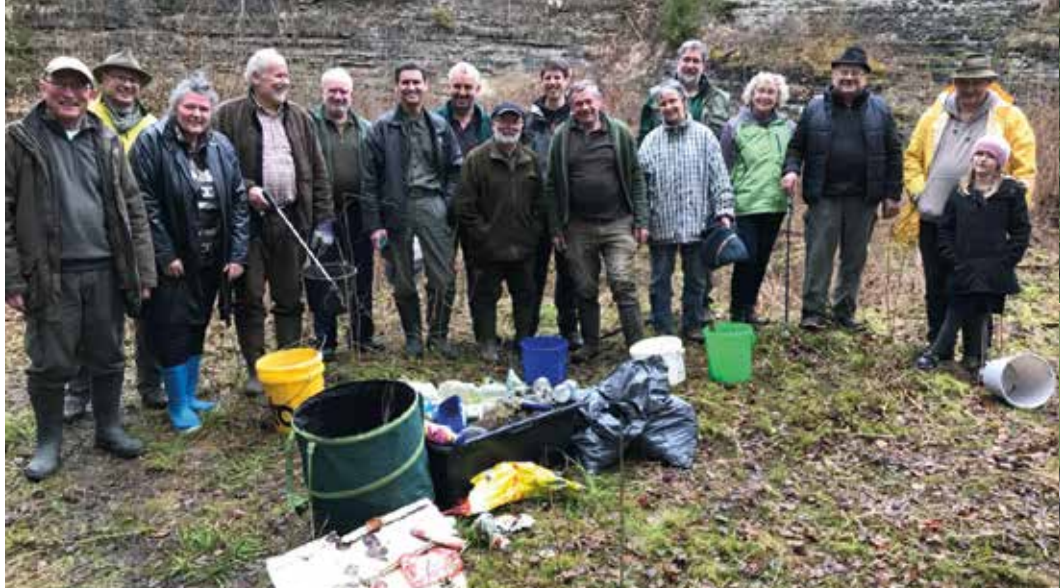
Putzaktion in der Niederholzer Halde, 2018